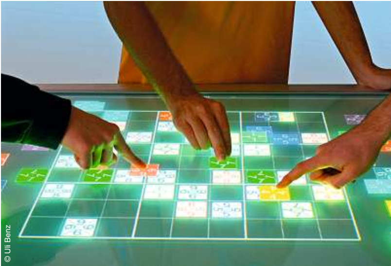
Am »Multitouch«: Gemeinsames Lösen eines Sudokus