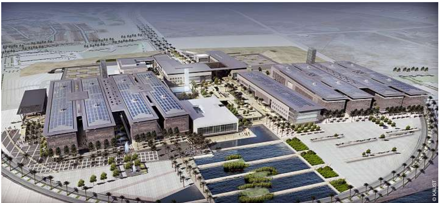
Ein Modell der jüngsten Uni der Welt: Die »King Abdullah University of Science and Technology« (KAUST) nahm am 23. September 2009 ihren Betrieb auf.

den. Etwa zwei Milliarden Dollar wurden verbaut, vorübergehend waren bis zu 54 000 Arbeitskräfte auf der Baustelle. So ist in nur zwei Jahren ein hochmoderner, durchdachter, zweckmäßiger und optisch ansprechender Campus entstanden. In der Mitte thront die Biblio-