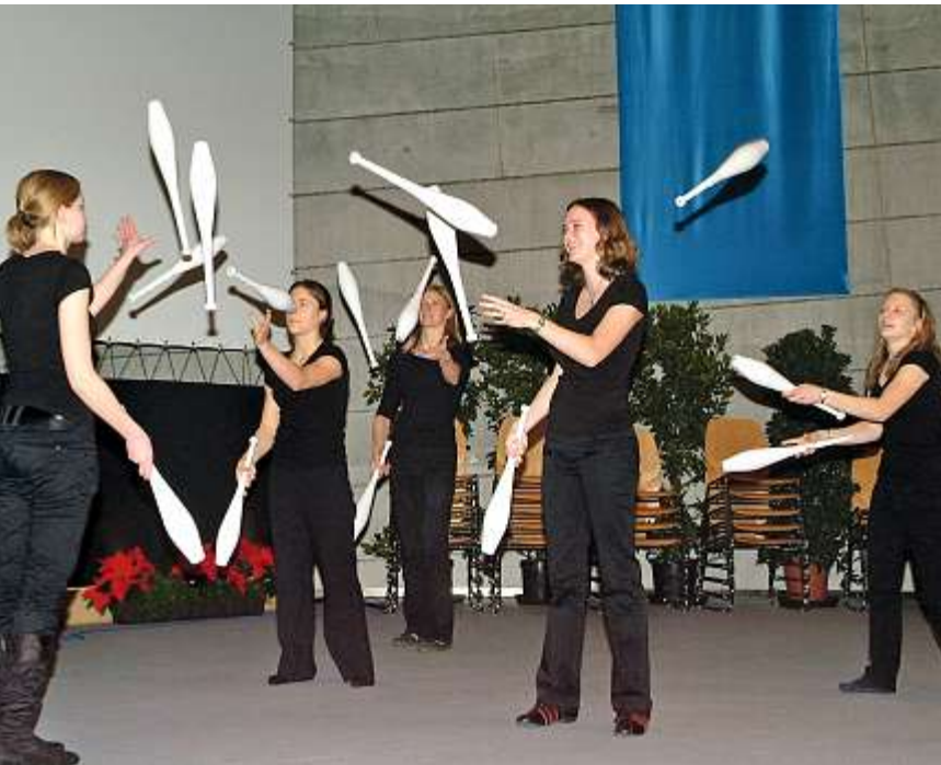
Die Akrobatikgruppe »Akro à la carte« des Zentralen Hochschulsports der TUM jonglierte zum Abschluss des Dies-Programms.