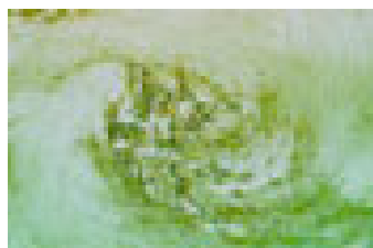
Der virale Vektor-Impfstoff MVA-Nef, eine Kombination aus dem Pockenimpfstoff Vaccinia-MVA und HIV-Nef (»negative regulating factor«), wird in Kultur vermehrt. Infizierte Zellen sterben und hinterlassen kleine Lücken, die »Plaques«.