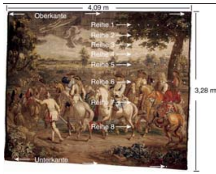
Die Tapiserie »Der Generalstab« aus dem Jahr 1724 stammt aus der Serie »Kriegskunst«, die für Kurfürst Max Emanuel von Bayern in Brüssel gefertigt wurde. Die weißen Messmarken dienen zur optischen Überwachung.

gen zum Ausdruck. Aus den Messungen ließ sich eine typische Verformung der Tapisseries von 0,08 m bis 0,16 m bei vier Meter Höhe (oder zwei bis vier Prozent relative Längenänderung) abschätzen.