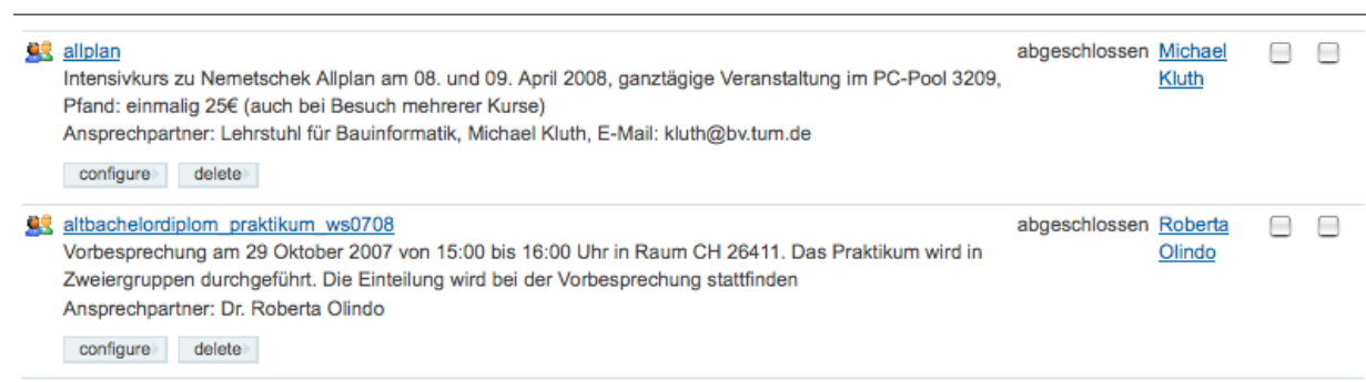
Abbildung 12: Bearbeitenansicht

Mit der Aktion 'Inhalte bearbeiten' erhalten Sie eine Übersicht über alle Gruppen, Verteiler und Mailinglisten, die Sie bearbeiten können. Sie können die einzelnen Gruppen aufrufen, konfigurieren oder löschen bzw. deren Definition ändern.